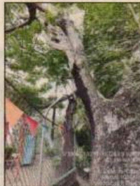
Fotografías 14, y 15. Ejemplar No 2 localizado sobre talud de la vía principal de la vereda Manga Vieja, contiguo a la institución.

CARRERA 56 No. 11-36 SANTIAGO DE CALI, VALLE DEL CAUCA TEL: 620 66 00 – 3181700 LINEA VERDE: 018000933093 www.cvc.gov.co