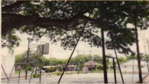
Fotografías 6, 7, 8, 9 y 10. Ejemplar número 2, localizado en la cancha de la institución sede principal corregimiento de San Marcos.

Citar este número al responder: 0713- 457032024 0713- 474912024