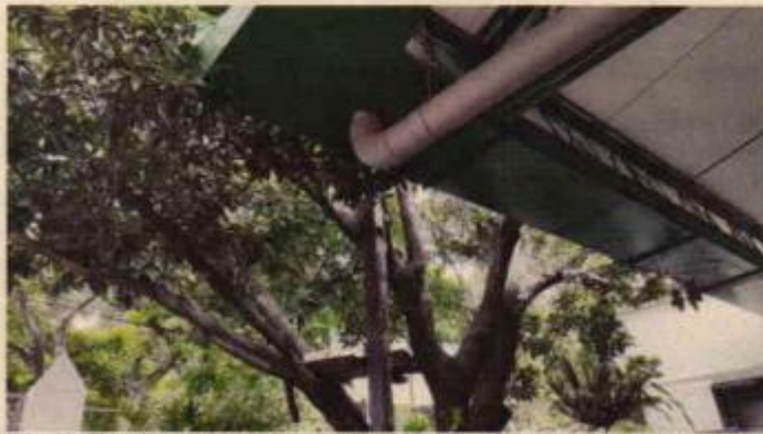
Fotografías 25, 26 y 27. Ejemplar especie Nispero, localizado dentro de la institución San Pedro Claver.

CARRERA 56 No. 11-36 SANTIAGO DE CALI, VALLE DEL CAUCA TEL: 620 66 00 – 3181700 LINEA VERDE: 018000933093 www.cvc.gov.co