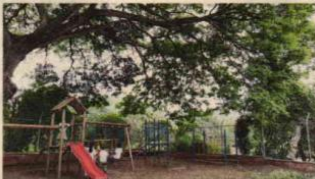
Fotografías 1, 2, 3, 4 y 5. Ejemplar número 1, localizado en el patio de juegos de la institución sede principal corregimiento de San Marcos.

CARRERA 56 No. 11-36 SANTIAGO DE CALI, VALLE DEL CAUCA TEL: 620 66 00 – 3181700 LÍNEA VERDE: 018000933093 www.cvc.gov.co