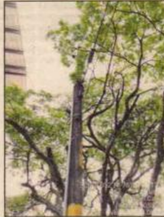
Fotografías 21, 22, 23 y 24. Ejemplares localizados en el andén externo de la institución.

CARRERA 56 No. 11-36 SANTIAGO DE CALI, VALLE DEL CAUCA TEL: 620 66 00 – 3181700 LINEA VERDE: 018000933093 WWW.CVC.GOV.CO