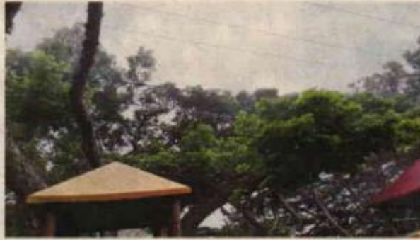
Fotografías 11, 12 y 13. Ejemplar No 1 localizado sobre talud de la vía principal de la vereda Manga Vieja, contiguo a la institución. Fuente: elaboración propia

Citar este número al responder: 0713- 457032024 0713- 474912024