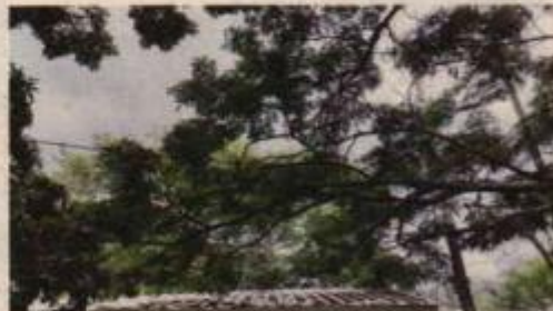
Fotografías 16, 17, 18 y 19. Ejemplar No 3 localizado al interior de la institución educativa, en conflicto con redes eléctricas e infraestructura.

CARRERA 56 No. 11-36 SANTIAGO DE CALI, VALLE DEL CAUCA TEL: 620 66 00 – 3181700 LINEA VERDE: 018000933093 www.cvc.gov.co